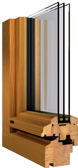
Darstellung: Bautiefe 80 mm Nadelholz / 3fach Isolierverglasung