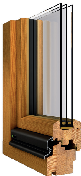
Darstellung: Bautiefe 80 mm Nadelholz / 3fach Isolierverglasung