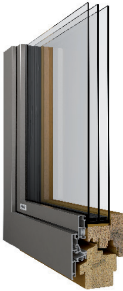
Darstellung: Bautiefe 95 mm Eiche / 3fach Isolierverglasung