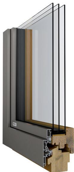
Darstellung: Bautiefe 95 mm Eiche / 3fach Isolierverglasung