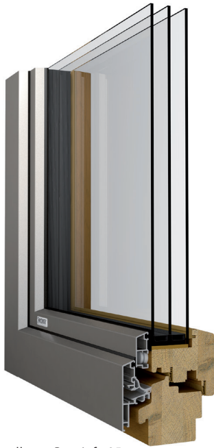
Darstellung: Bautiefe 95 mm Eiche / 3fach Isolierverglasung